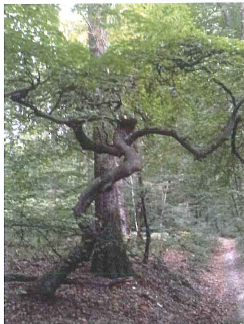
Heureusement, il existe d'autres hêtres non malade que l'on peut découvrir en forêt.

Ce nom de "fau" est un mot ancien pour désigner le hêtre (usité en français jusqu'au XVIIIe siècle).