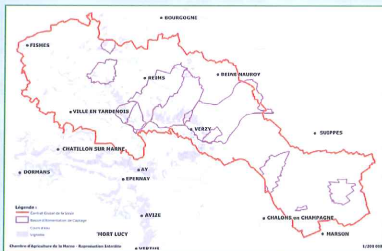
Territoire du Contrat Global pour l'eau de la Vesle Marnaise

Sur le territoire de la Vesle Marnaise, les acteurs du territoire (collectivités, agriculteurs, viticulteurs, artisans...) se sont également fédérés localement autour de la signature d'un Contrat global pour l'Eau sur la période 2009-2015. En bref, 58 signataires engagés pour l'atteinte de 7 objectifs par la mise en place d'un programme d'actions ambitieux de 87 millions d'euros en 6 ans. Pour y parvenir, ce contrat s'articule autour de 6 volets : eau potable, assainissement, agriculture/viticulture, milieux aquatiques et humides, artisanat/industrie/presseoir et animation/communication.