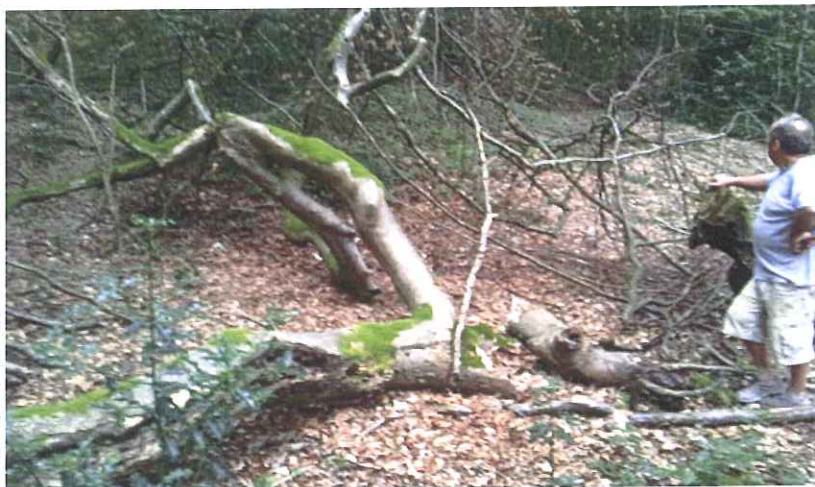
Hêtre tortueux à terre suite à maladie